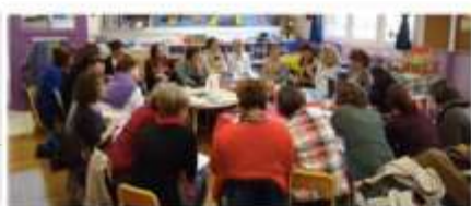
Mise en oeuvre du cahier de suivi des apprentissages : les enjeux, les supports (format papier, numérique...)