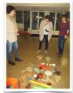
Création d'univers sonores : le soundpainting

Ces échanges, ces partages sont une source d'une grande richesse pour repenser, valoriser, et mutualiser les pratiques et favoriser les innovations dans les différents domaines enseignés à l'école maternelle.