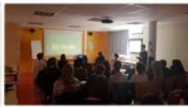
Utilisation des images pour raconter