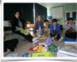
Fabrication et utilisation de marionnettes