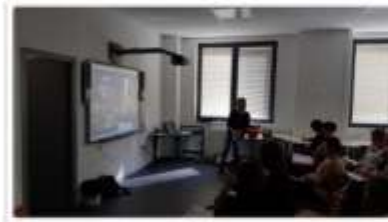
L'image au service de l'acquisition du lexique chez les TPS