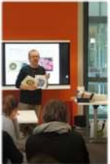
Mémoires en images chez les TPS