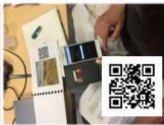
Utilisation des QR code pour partager avec les familles les productions des enfants (enregistrements sonores, vidéos)