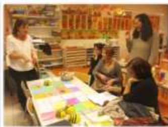
Manipulation des BEEBOT : début de programmation !