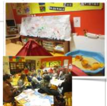
Aménagement des espaces