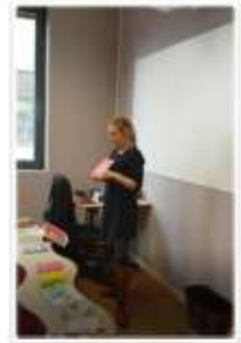
La conscience phonologique